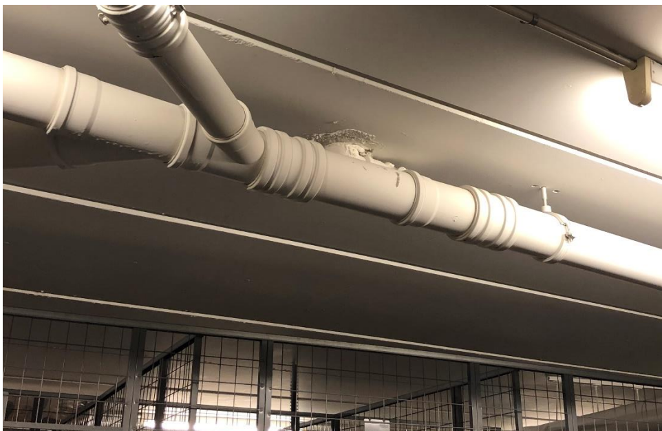
Figur 1: Manglende brandsikring og brandtætning ved faldstammer/afløb udført i plast i kælder