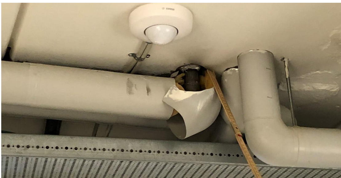
Figur 2: Manglende brandtætning ved installationsgennemføring i kælder/underetage