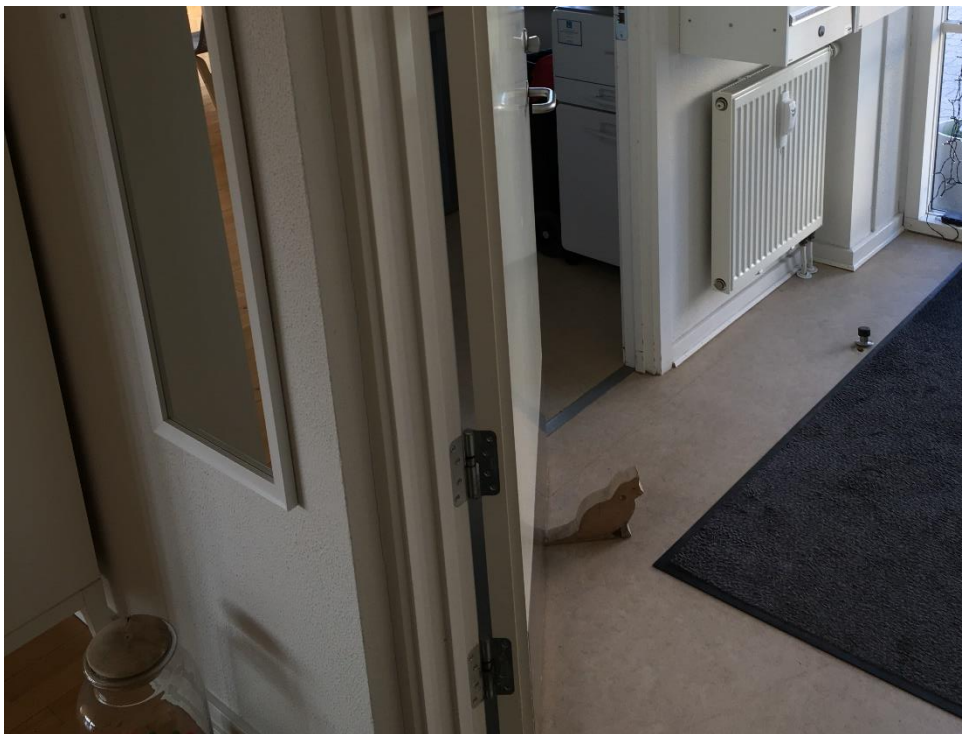
Figur 3: Branddør fastholdt i åben stilling med træfigur. Når der er behov for at fastholde branddøre i åben stilling, skal disse døre udføres med et automatisk branddørlukningsanlæg (ABDL-anlæg).