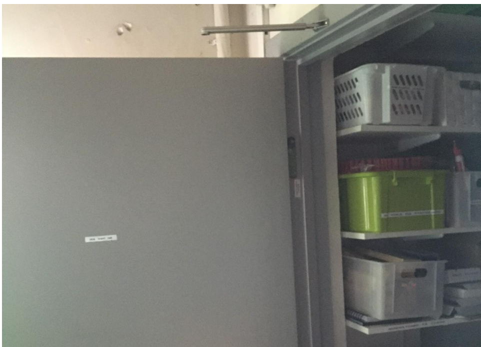
Figur 4: På branddør mellem fra depot til teknikrum er selvlukkemekanismen sat ud af funktion. Når der er behov for at fastholde branddøre i åben stilling, skal disse døre udføres med et automatisk branddørlukningsanlæg (ABDL-anlæg).